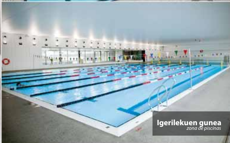
Igerilekuen gunea zona de piscinas