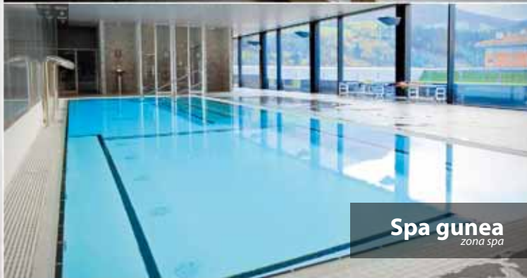
Spa gunea zona spa