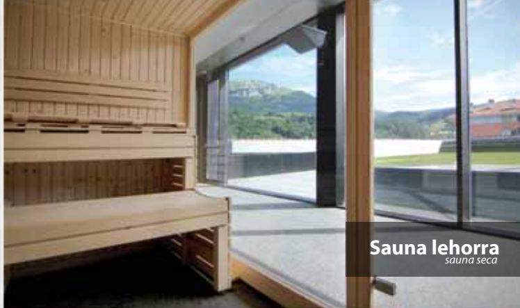
Sauna lehorra sauna seca